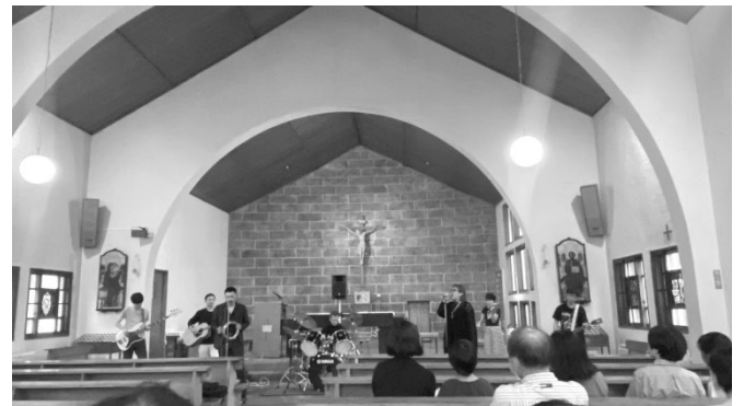
2023年 由比ガ浜教会にて

そして演奏できないまま三年…長かった。時々集まっていましたが、その三年の間、二人のメンバーが結婚して、一人は子供が生まれて…など、環境の変化もありました。そして昨年、わたしの出身教会である由比ガ浜教会が献堂110周年を迎え、「バンドやりませんか？」とお声がけ頂き、コロナが5類に移行したこともあって、ようやく復活しました。久しぶりに集まって音を出してみると、意外にも以前のようにうまくいきそうで、ホッとしました。ただこの3年の間に、わたしの体力の減退も著しく…当日の機材の搬入と搬出だけで死にそうになっちゃいました…。なんと、情けない。