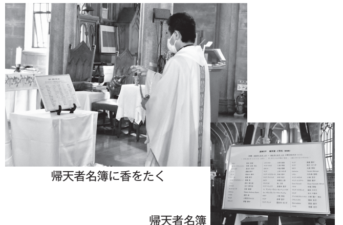
帰天者名簿に香をたく