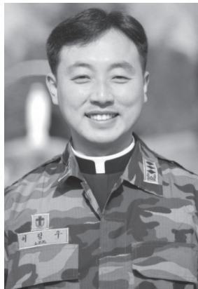
従軍司祭時代の師

A：膝の再手術で留守をし、コロナ禍もあって皆さんと親しく関わることができず離任してしまって申し訳ない気持ちです。山手でのささやかな交流の思い出を今も大事に温めています。人見知りの私ですが、機会があれば大津にお越しください。