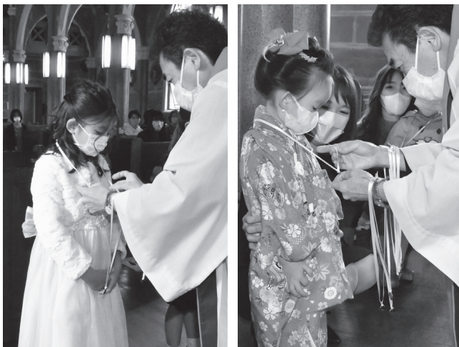
メダイをかけていただく