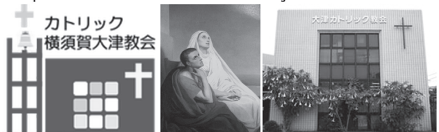
公式HPより教会ロゴ 聖堂にあるご絵より保護聖人の聖モニカ

https://st-monica-church-ootsu.jimdofree.com/