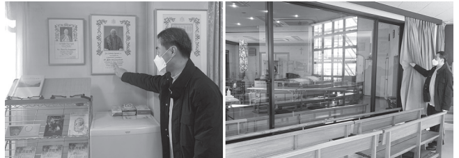
(左)執務室内に飾られている3人の歴代教皇写真を指して大津教会の歴史をご説明 (右)教会内を案内してくださる師

す。タンパク質を多めに摂るようにしなければならないのですが高いですから…。運動面では走ることは禁止なので、全天候型で安全な平地であるショッピングモール内をウォーキングしています。買い物もせずに歩くだけの怪しい人かもしれません。(笑)