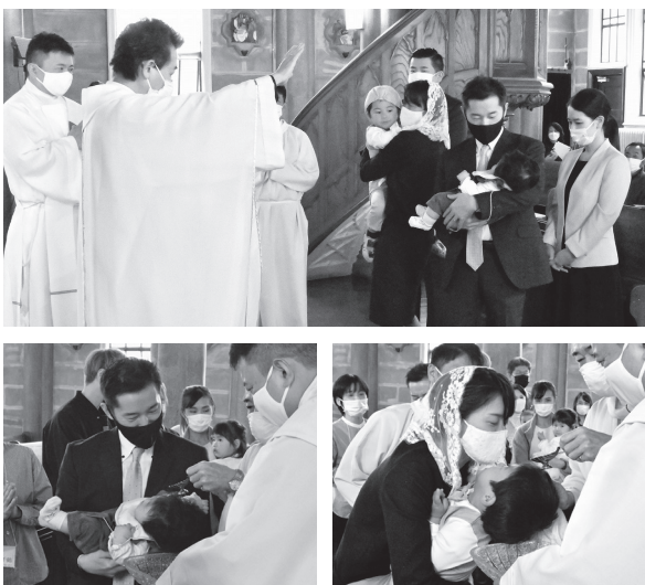
(上)接手 (下)聖水を注ぐ